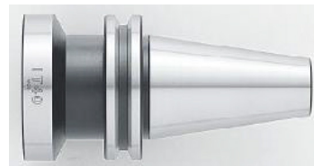
[ IT ]