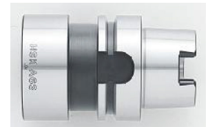
[ HSK A ]