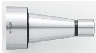
[ NT ]