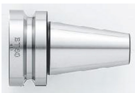
[ BT ]

Gran variedad de conos disponibles: BT30, NT30 BT40, NT40, CAT40, IT40, BT50, NT50, CAT50, IT50, ST32, R8, HSK A 63 y HSK A 100.